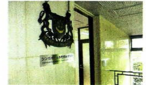
↑ シンガポール共和国名誉総領事館 (株式会社シマノ 本社ビル内)