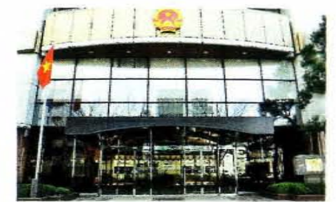
↑ ベトナム社会主義共和国総領事館

堺市には現在4つの国際的な機関が設置されています。ジェンダー平等と女性のエンパワーメントのための国際連合の機関であるUN Women日本事務所。ユネスコの賛助機関で、アジア・太平洋地域の無形文化遺産の保護のための調査研究拠点であるアジア太平洋無形文化遺産研究センター。さらに外国公館として、2009(平成21)年にはベトナム社会主義共和国総領事館が、2011(平成23)年にはシンガポール共和国名誉総領事館が開設され、経済・観光・文化など様々な分野での国際交流、国際協力などを推進しています。