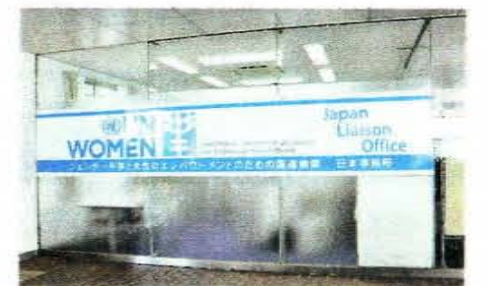
↑ UN Women 日本事務所 (堺市立女性センター内)