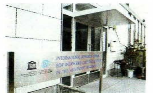
↑ アジア太平洋無形文化遺産研究センター (堺市博物館内)