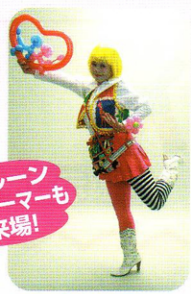
バルーンパフォーマーも来場!