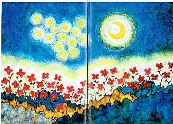
as time goes by no'55