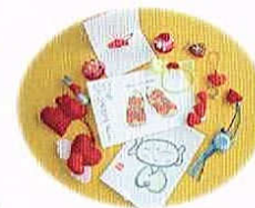
赤いハートは活動のシンボルです

生命のメッセージ展会員による手作りグッズを中心に、手作り絵本、カード、CDなどのオリジナル商品を販売しています。